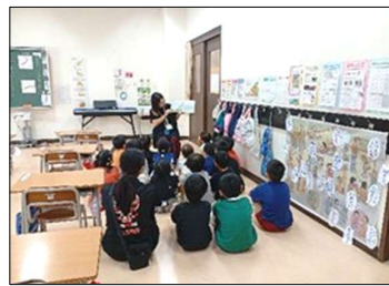
5/18 保護者の協力による絵本読み聞かせ 展開にどきどき