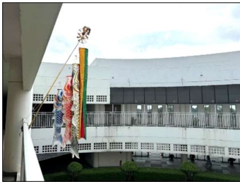
5/5 チカラン日本人会様から頂いたこのぼりが青空に映える