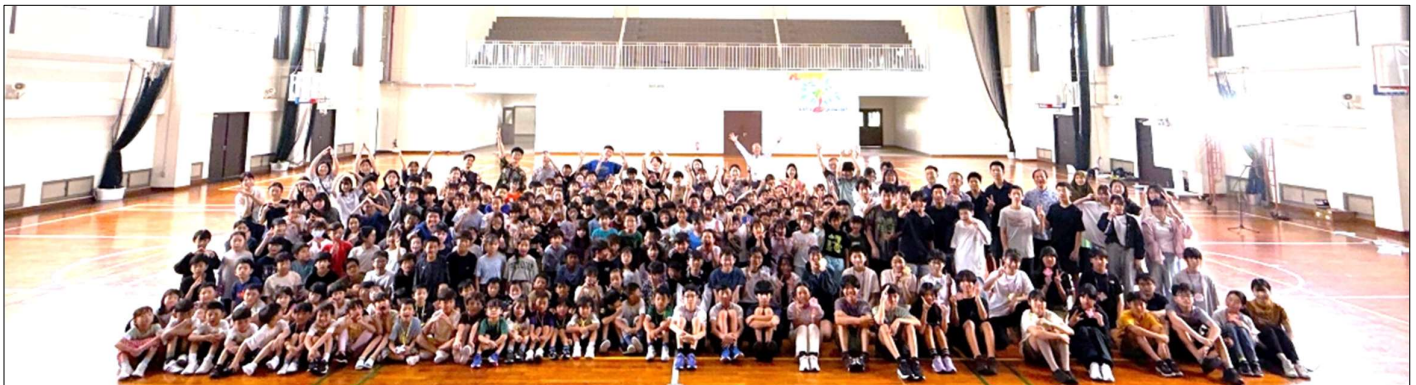
4/24 「入学を祝う会」 後方に児童生徒会目標が見える 皆でさらに素晴らしい学校をつくる