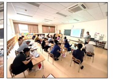
5/18 ハラスメント未然防止についての教員研修を実施