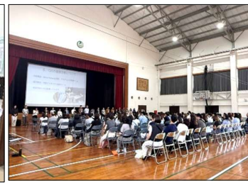
5/9 教育活動説明会 皆様の協力でCJSの子どもがさらに輝く