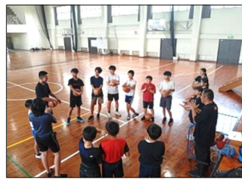
5/7 バスケットボール部 円陣になって気持ちを合わせる