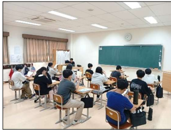
5/7 朝読書 集中して読む、考える、作者や自己と対話する

授業参観、教育活動説明会、小学部・中学部懇談会には多くの皆様にご参加いただきありがとうございます。一学期も半ばとなり、授業はもちろん、係・委員会、部活動等、子どもたちは元気に活動しています。6月には運動会もあります。一方で少し疲れが出てくるころと思います。温かく受容したいと思います。また心配なこと等あれば何なりとご相談ください。いつもチカラン日本人学校をありがとうございます。