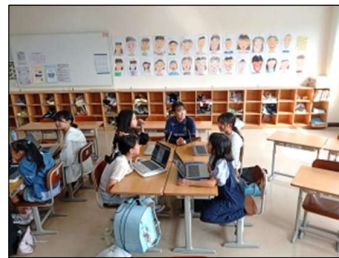
5/7 体育委員会 「丈夫な体をつくる」ことについて意見交換中