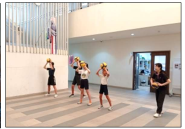
5/7バレーボール部 正確なトスから強いアタックにつなぐ