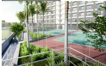
テニスコート・フットサルコート