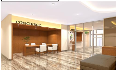
エントランス コンシェルジュ