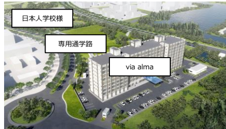
日本人学校様との位置関係