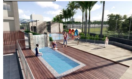
屋外キッズプール