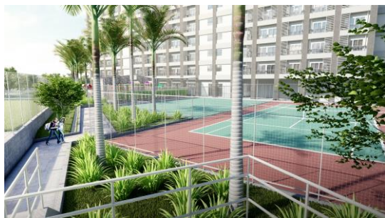
テニスコート・フットサルコート