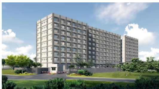
北側からの当施設外観

この事業を通じ、両社とが一体となり、インドネシアでJapan Quality(日本品質)の安全・安心の住環境を提供することで、現地に住まう方々の暮らしの更なる質向上に貢献してまいります。