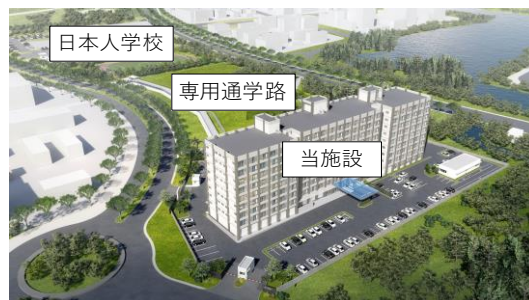
日本人学校への専用通学路