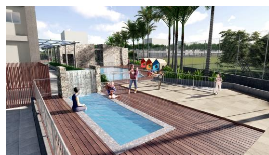
屋外キッズプール